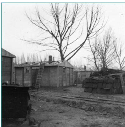
Die Plattenhaussiedlung Poppenbüttel im Bau

Die auf dieser Anlage bestatteten 34 Frauen des KZ-Außenlagers Sasel sowie ein Säugling starben größtenteils nach Todestransporten der SS im April 1945. Nachdem das Lager geräumt worden war, kamen die Frauen Mitte April 1945 aus den Außenlagern Langenhorn und Helmstedt-Beendorf in das KZ Sasel. 1957 wurden ihre Gräber vom Friedhof Bergstedt auf diese Anlage umgebettet.