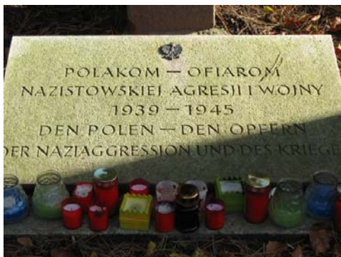
Gedenkstein der polnischen Grabanlage

Etwa 300 Gräber polnischer Opfer wurden 1949 unter Beteiligung des polnischen Konsulates aus ganz Hamburg hierher umgebettet. 1950/51 stattete der Verband Polnischer Flüchtlinge in Deutschland die Gräber mit Steinkreuzen aus, die als Wappen den polnischen Königsadler trugen. 1973 wurden die Steinkreuze durch Kissengrabsteine ausgetauscht. Einige Kreuze sind um das zwei Meter hohe Granitkreuz und die Gedenkplatte gruppiert worden.